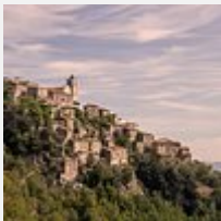
Yvonne273 Estavayer-le-Lac, Suisse