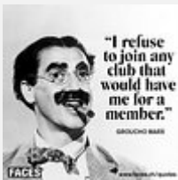
rOlandbrunner Zurich, Suisse

La décoration fleurale était belle et adaptée. Propreté suisse.