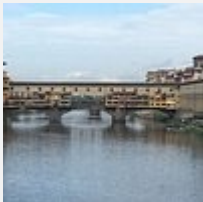
Gaudel23 Nice, France